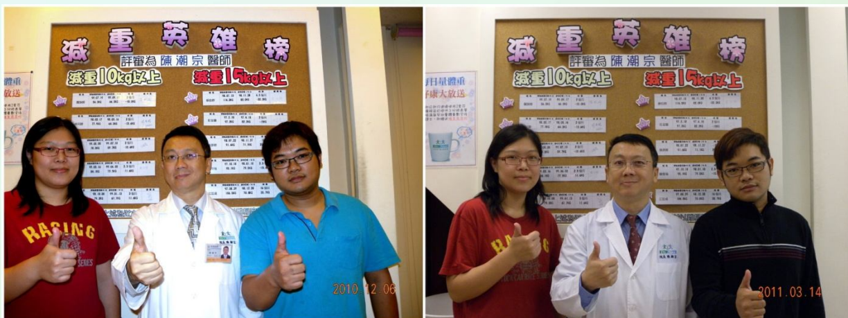
夫妻檔，療程4個月：男-20.4kg 女-19.6kg